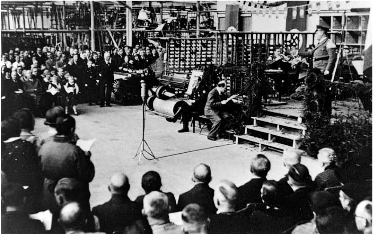
»Werkpausen«-Aufnahme in der Firma Kracht.