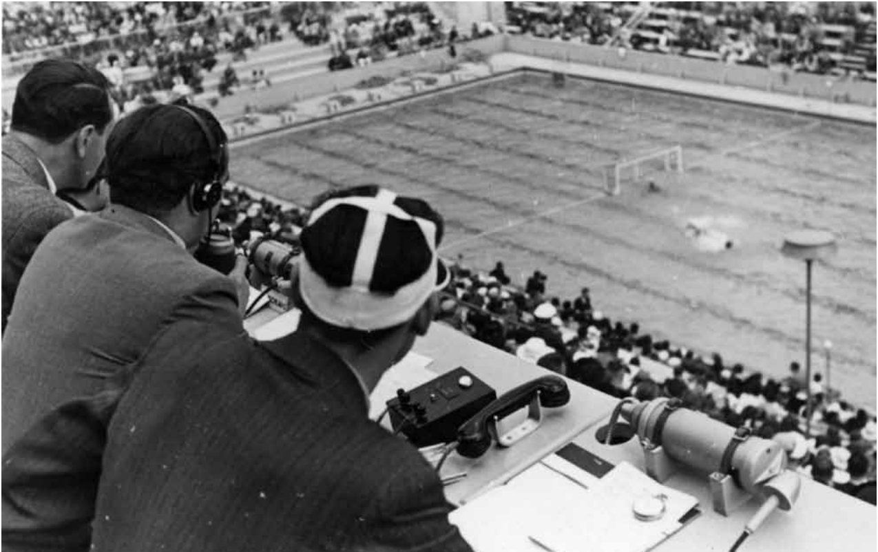
Rundfunkreporter verfolgen ein Wasserballspiel im Olympia-Schwimmstadion.