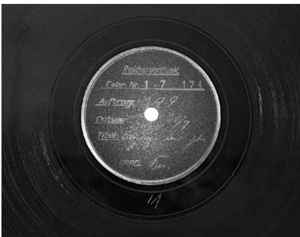
Schallfolie einer Olympia-Rundfunkreportage von 1936.

Auch an rundfunkspezifischem Bildmaterial von den Olympischen Spielen 1936 mangelt es nicht. Rund 1.000 Olympia-Fotos der Reichs-Rundfunk-Gesellschaft (RRG) sind im DRA archiviert, die Einblick in die Arbeit des Rundfunkpersonals geben. Sie zeigen Reporter bei der Live-Berichterstattung, Rundfunktechniker beim Aufbau von Sprecherplätzen, Grafiken der Mikrofonstandorte an den Sportstätten und vieles mehr. So eröffnet dieser Bildbestand eine interessante, eher dokumentarisch denn propagandistisch aufgeladene Perspektive 3 auf die Olympischen Spiele von 1936, deren visuelle Erinnerung ansonsten primär von den Bildern der sportlichen Wettkämpfe und insbesondere auch von dem viel diskutierten »Olympia-Film« Leni Riefenstahls geprägt ist.