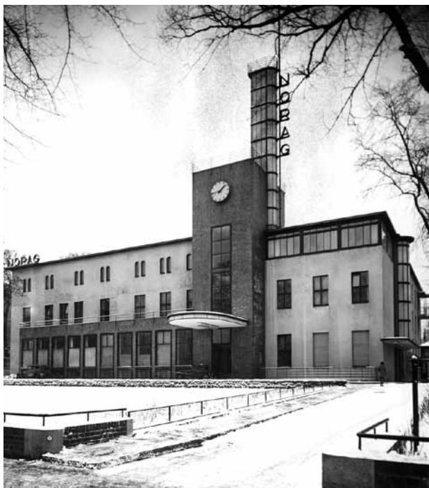
Das Noraghaus. 1931.

Am 8. Januar 1931 erhielt der Rundfunk in Norddeutschland eine neue Anschrift: Hamburg, Rothenbaumchaussee 132. Diese Adresse hat seit nunmehr 80 Jahren Bestand. Auf dem damals gut 6.000 Quadratmeter großen Gelände im gutbürgerlichen Stadtteil Harvestehude gab die damalige Nordische Rundfunk AG, kurz: Norag, eine neue architektonische Visitenkarte ab. Nach außen zeigte sich die 47 Meter lange Fassade hanseatisch zurückhaltend, präsentierte eine von der Neuen Sachlichkeit beeinflusste Gebäudefront, innen aber wartete man mit dem neuesten Stand der Technik auf. 1